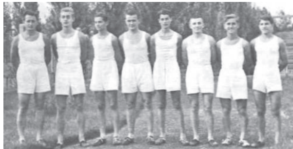
Атлетска екипа Друге мушке гимназије у Новом Саду (1938/39)

На богатој традицији, и у сусрет новим изазовима, развијају се савремено физичко васпитање и спорт у Војводини. Важећа законска регулативе идентификује спорт као делатност од посебног интереса за Републику Србију 2 . Спорт обухвата све облике физичке активности који, кроз неорганизовано или организовано учешће, имају за циљ изражавање или побољшање физичке спремности и духовног благостања, стварање друштвених односа или постизање резултата на такмичењима свих нивоа 3 .