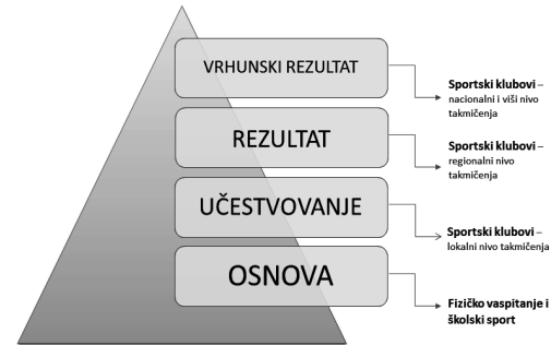
Пирамида спортског развоја

По много чему, школски спорт има одлике спорта за све (ученике). Притом се релације спорта за све са врхунским спортом често тумаче теоријом дупле пирамиде: масовност и велики обухват спорта за све дају основу за врхунске појединце, и обрнуто, врхунски спортисти представљају узоре (моделе) и инспирацију за појединце који се укључују у спорт. Што је шира основа пирамиде, тј. што се више људи бави спортом, веће су шансе да појединци достигну врх у такмичарском бављењу спортом. Основа пирамиде односи се на стицање основних кретних вештина, бављење разноврсним спортским активностима, усвајање основних знања и позитивних ставова према физичкој активности и спорту, и одговара школском физичком васпитању. На следећи ниво, ниво учествовања, прелази један број појединаца, посебно заинтересован за одређене спортове и учествовање у такмичењима на основном такмичарском нивоу. Школски спорт би одговарао овом нивоу спортске пирамиде. Са сваком следећим нивоом, расте степен ангажованости, спортске специјализације и спортског учинка, а број учесника опада, да би на врху пирамиде било места само за најбоље. Да би се постигла спортска изузетност , односно, врхунски спортски резултат, неопходно је поред талента, способности и ентузијазма спортисте, располагати одговарајућом организационом, административном и финансијском подршком, ефективном селекцијом, материјално-техничким условима и врхунским системом тренирања, а од значаја су и други фактори, попут породичног миљеа 14 .